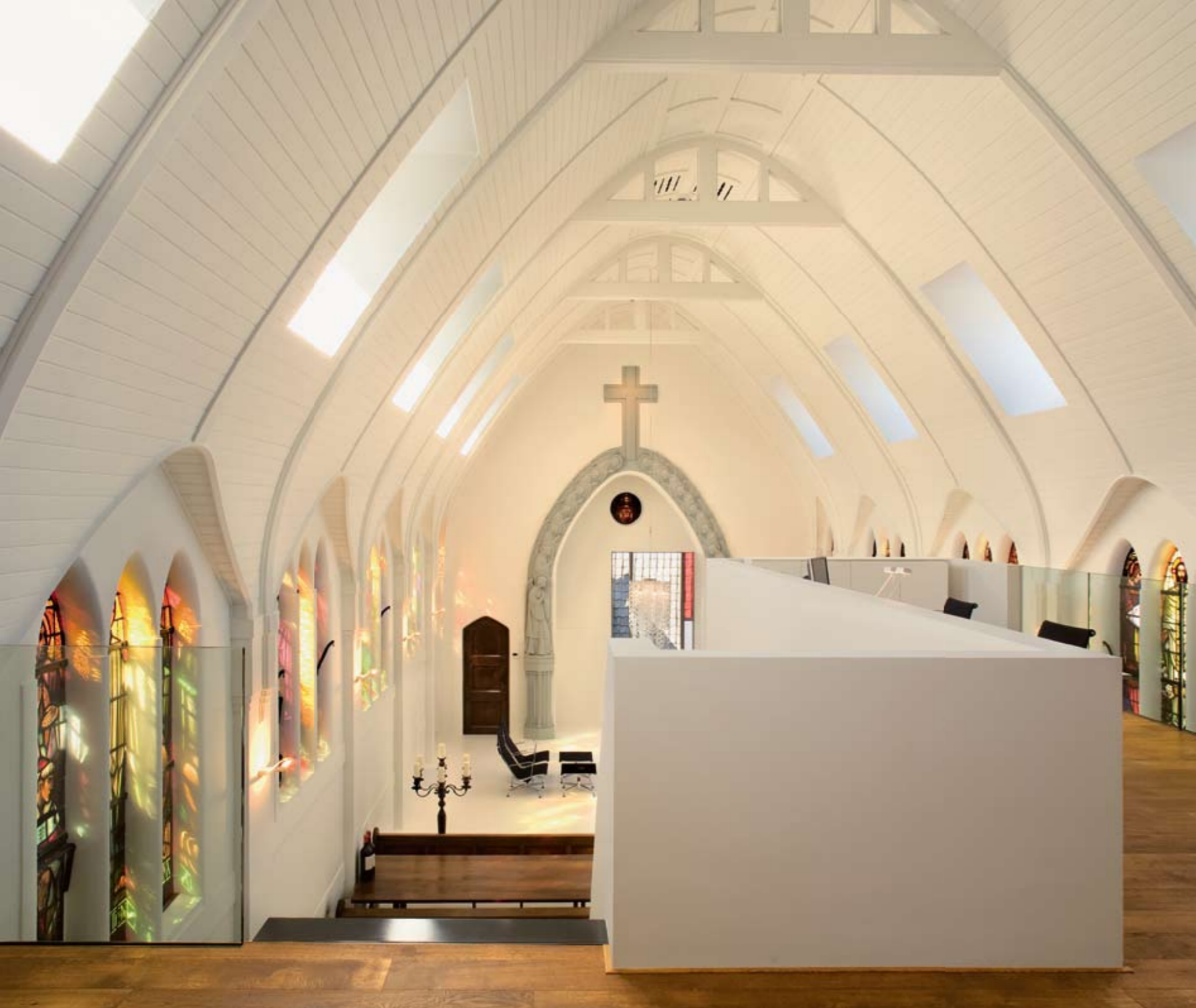
POGLLED Z BALKONA NA PROSTOR, OSVETLJEN Z NOVIMI STREŠNIMI OKNI IN BARVNIMI SENCAMI VITRAŽEV.