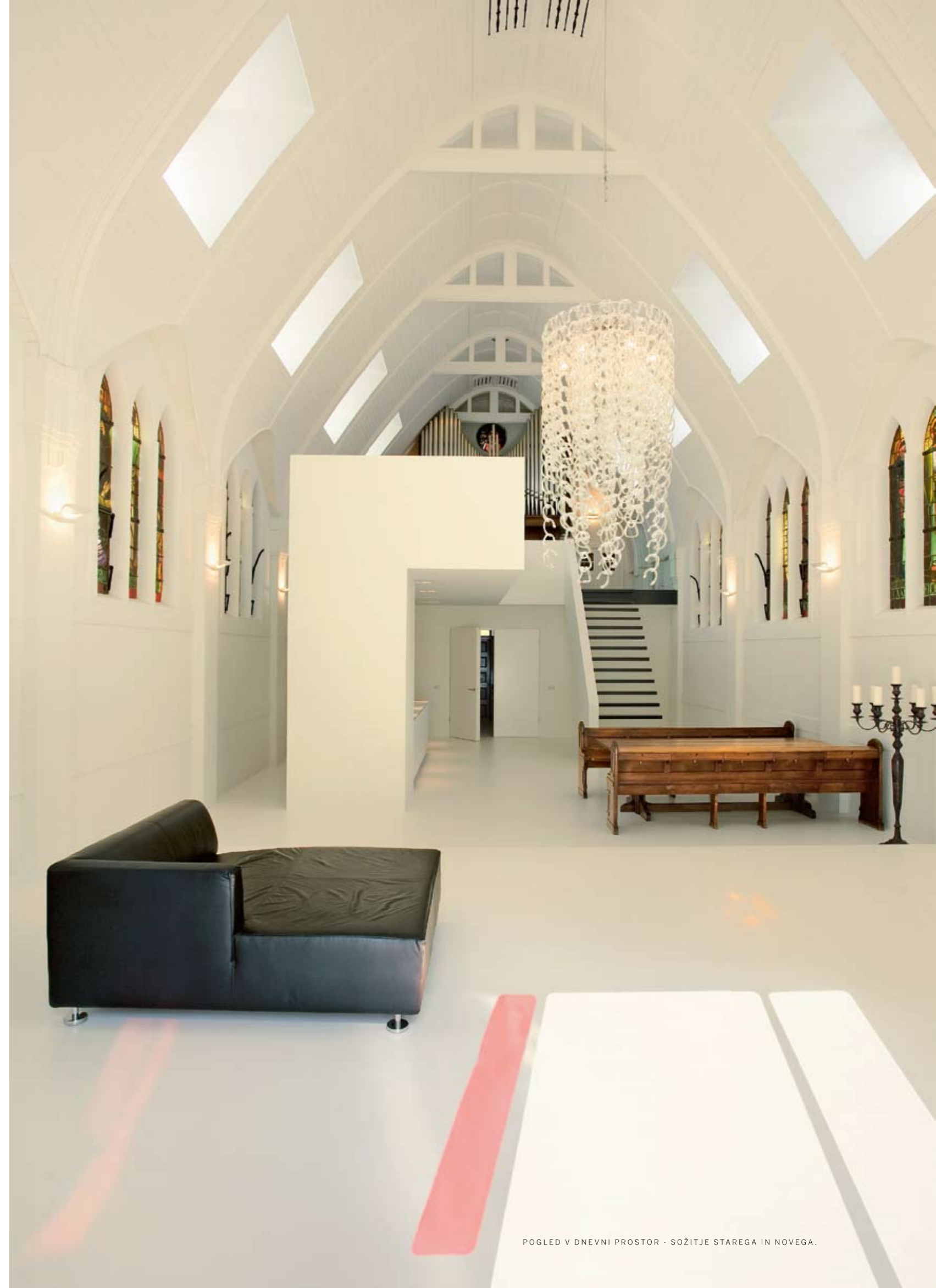
POGLED V DNEVNI PROSTOR - SOŽITJE STAREGA IN NOVEGA.