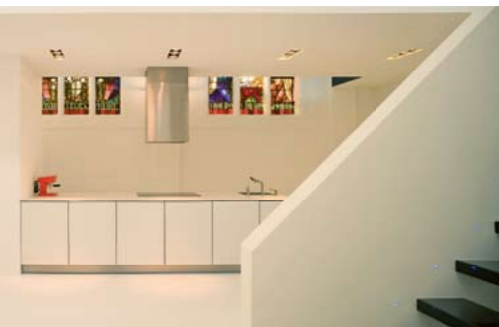
POGLED NA KUHINJO

Kapela je postala zavetje domačega ognjišča.