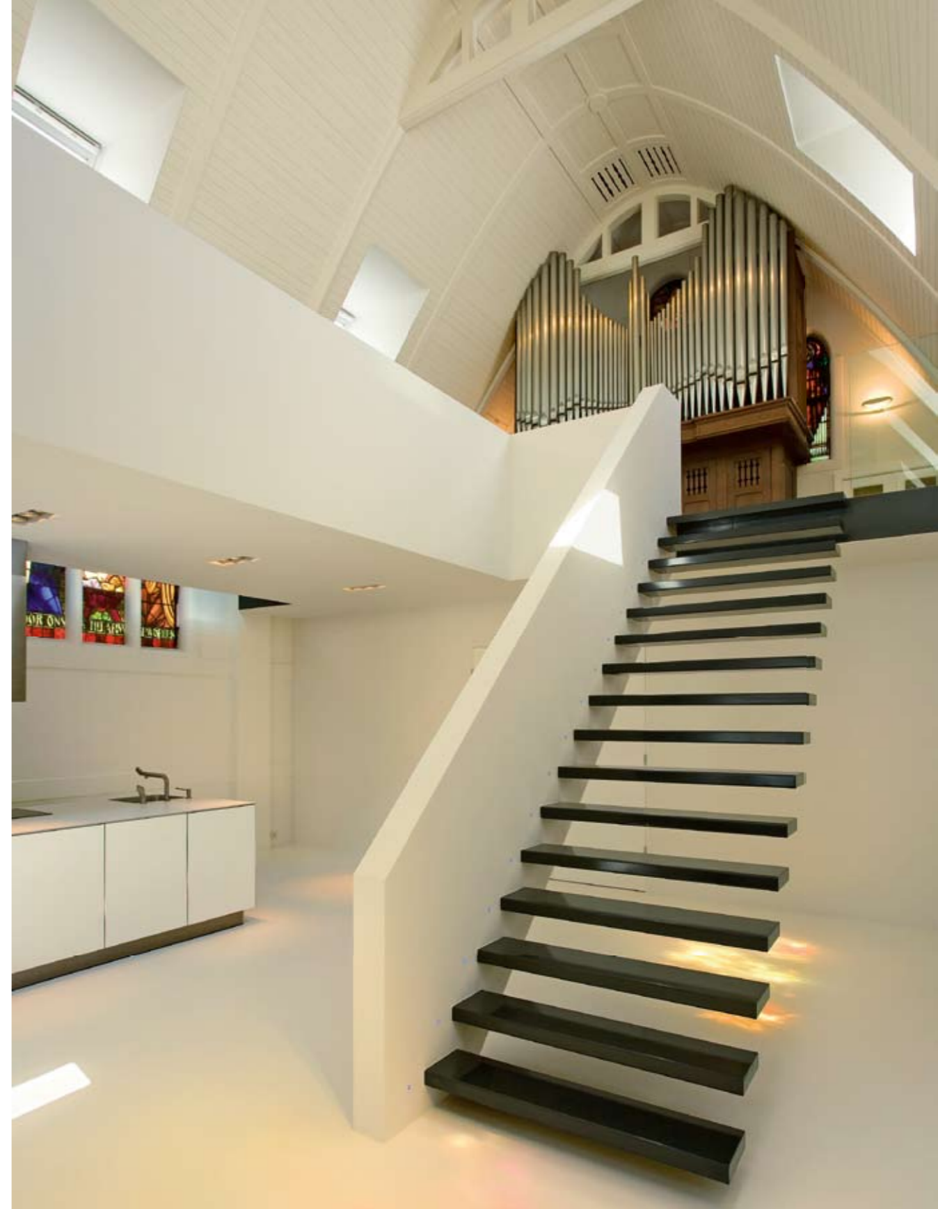
STOPNIŠČE NAS POPELJE DO BALKONA Z ORGLAMI IN ŠTUDIJSKEGA KOTIČKA V PODALJŠKU BALKONA.

Stene dnevnih prostorov so prebarvane v belo, kar občutek svetlobe in prostornosti še potencira in dodatno poudari vitraže.