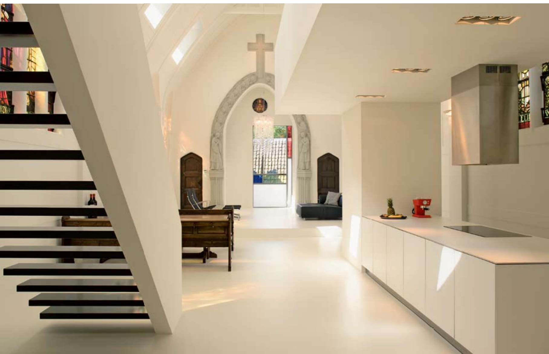
POGLED PREK KUHINJSKEGA DELA SKOZI OHRANJEN PORTAL PROTI NOVEMU "MONDRIANOVEMU" OKNU.

Kapela je postala zavetje domačega ognjišča.