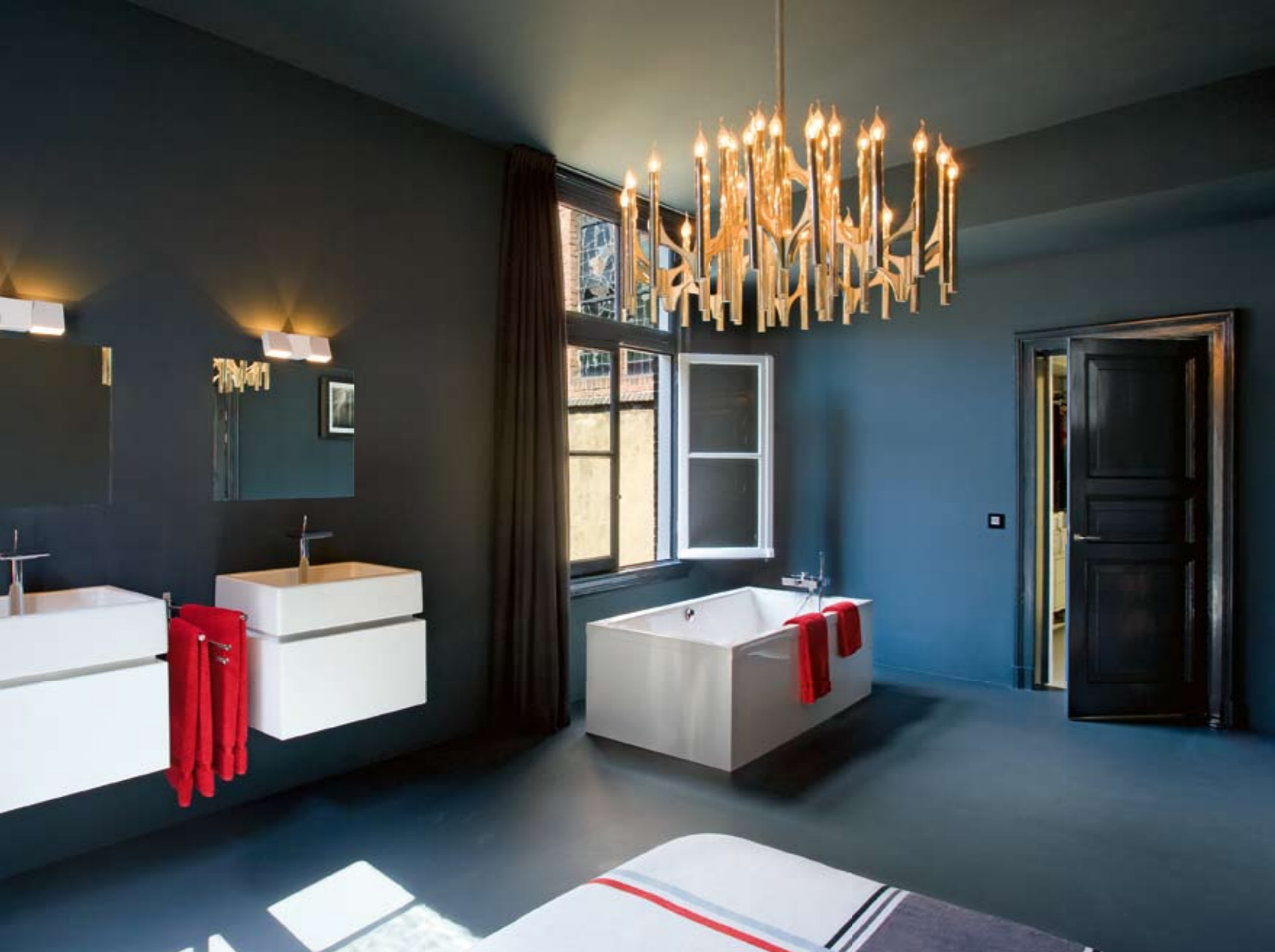
SPALNICA Z UMIVALNIM DELOM JE LOČENA OD BIVALNEGA DELA TUDI S TEMNO BARVO - BARVO NOČI.

Prostor ne ponuja razgleda na okolico, zato so za komunikacijo z zunanjim svetom dodali okno, ki gleda na ulico. Navdih za oblikovanje novega okna so bila dela abstraktnega slikarja Pieta Mondriana. Za njegovo umetnost je značilno, da je uporabljal primarne barve: rumeno, rdečo in modro, ob boku bele, črne in nevtralne sive. V neposredni bližini kapele-stanovanja je hiša Schroeder. Pri načrtovanju te hiše je arhitekt Gerrit Rietveld prenesel princip Mondrianovih vizualnih podob v tretjo dimenzijo. »Okno v svet« prenovljene kapele je homage arhitektu Rietveldu in hkrati večplasten dialog z današnjim zunanjim svetom, z umetnostjo in zgodovino.