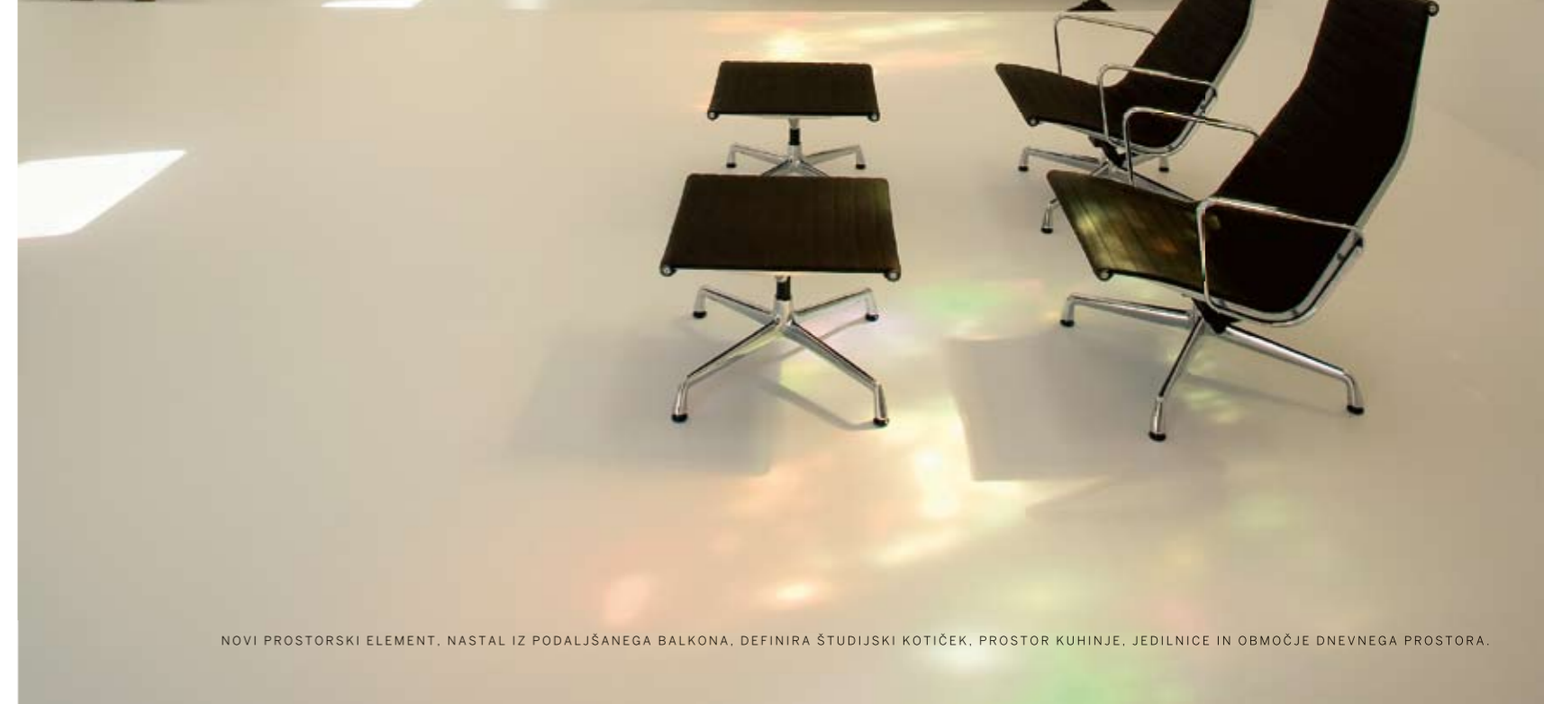
NOVI PROSTORSKI ELEMENT, NASTAL IZ PODALJŠANEGA BALKONA, DEFINIRA ŠTUDIJSKI KOTIČEK, PROSTOR KUHINJE, JEDILNICE IN OBMOČJE DNEVNEGA PROSTORA.