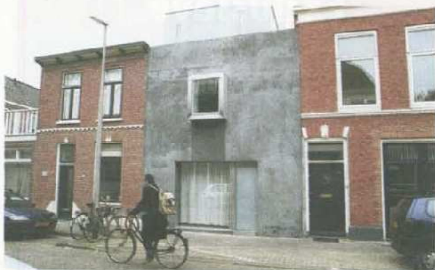
Ook toen de woning nog opslagpand was, was de gevel grijs en zaten op dezelfde plekken als nu ramen en deuren. Toch oogt het totaal anders. Ook nieuw: de brievenbus zit verstopt achter de handgreep van de voordeur, het huisnummer ontbreekt