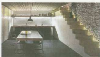
De constructie is ook vaak de afwerking. Op de begane grond loop je op beton en is de muur niet afgestuct.