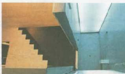
De wanddelen tussen de woon- en badkamer kunnen worden weggelapt, zodat je elkaar steeds kunt zien.