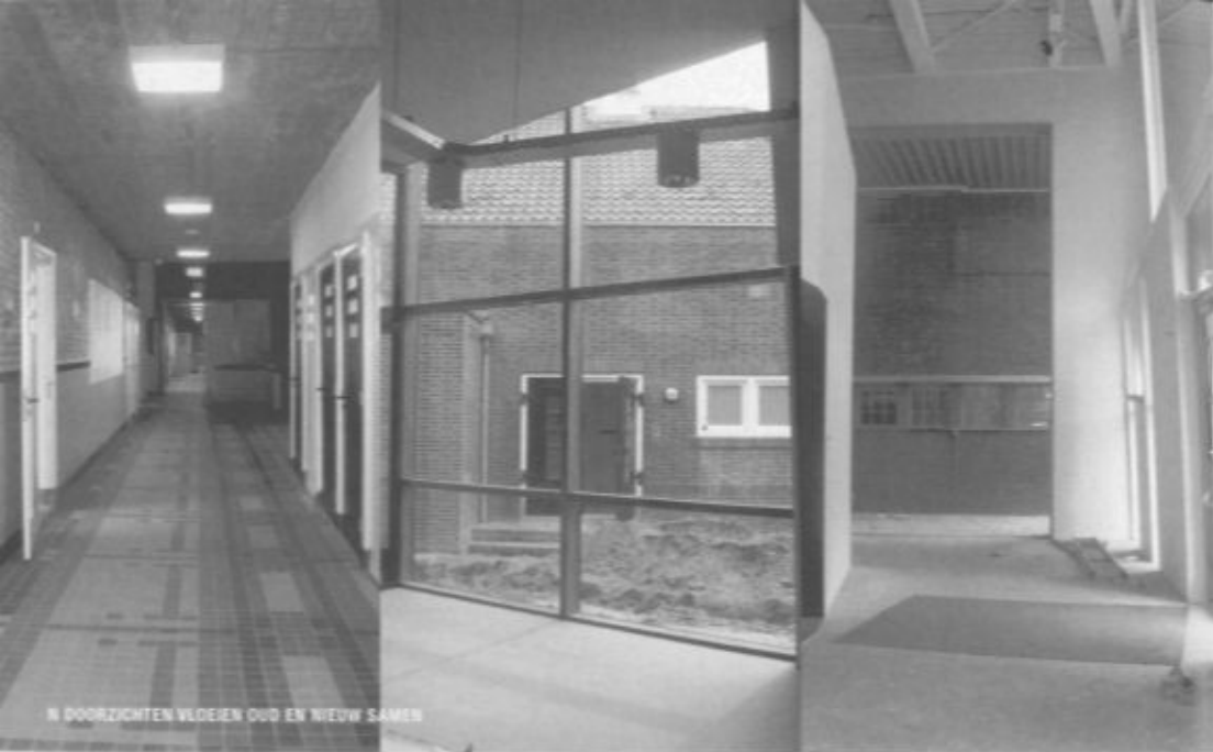
IN DOORZICHTEN WELDEN OUD EN NIEUW SAMEN

De aanpak van beide scholen verdient dan ook een aparte vermelding, want ondanks dat niet al het originele materiaal hergebruikt kon worden – wat bijvoorbeeld bij de vloertegels in de Beatrixschool het geval was – is zo zorgvuldig mogelijk getracht het oorspronkelijke beeld te herstellen. Het waren schitterende scholen en dat zijn ze nu weer. Hier is sprake van een zeer geslaagd voorbeeld van hergebruik.