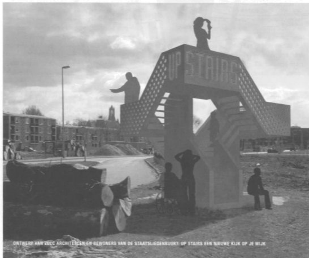
ONTWERP VAN ZECC ARCHITECTEN EN BEWONERS VAN DE STAATSLIEDENBUURT: OP STAIRS EEN NIEUWE KLIJ OP JE WILK

DE POLITIEKE PARTIJEN DIE BIJ DE UTRECHTSE GEMEENTERAADSVERKIEZINGEN FLINK WONNEN, STAAN TRANSPARANTE VERANDERINGSPROCESSEN VOOR. ZIJ DOELEN DAARMEE ONDERMEER OP DE HERSTRUCTURERING VAN DE NAOORLOGSE WIJKEN. TRANSPARANTIE IS VOOR GROENLINKS EN D66 NADRUKKELIJK EEN INVESTERING IN SOCIALE COHESIE. HOE DIT ZICH KAN VERTALEN NAAR BELEID, BLIJKT UIT EEN VERBETERINGSPROJECT IN DE STAATSLIEDENBUURT.