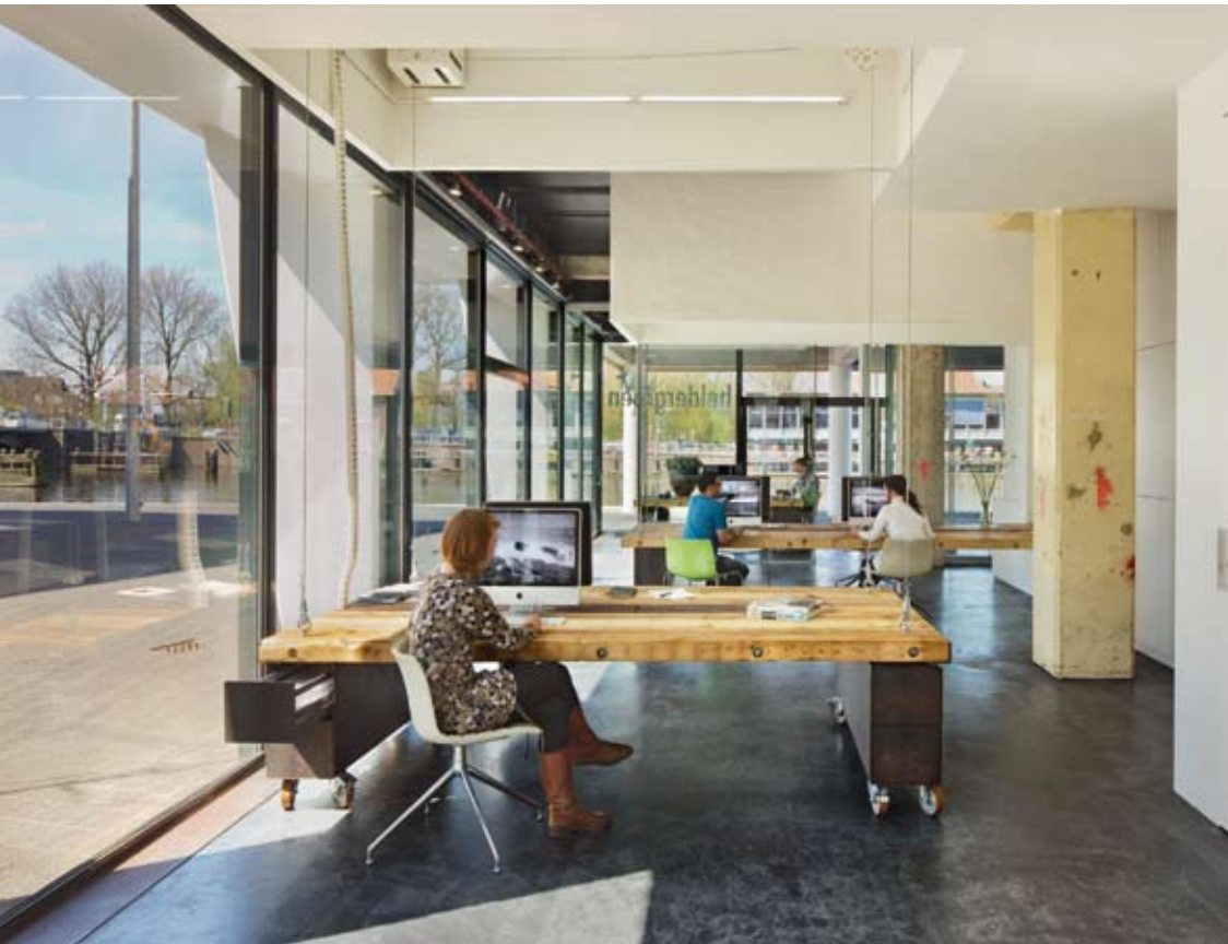
Studio Helder groen heeft naar drie zijden een geheel glazen gevel. De medewerkers hebben zicht op het water en de binnenstad van Haarlem.