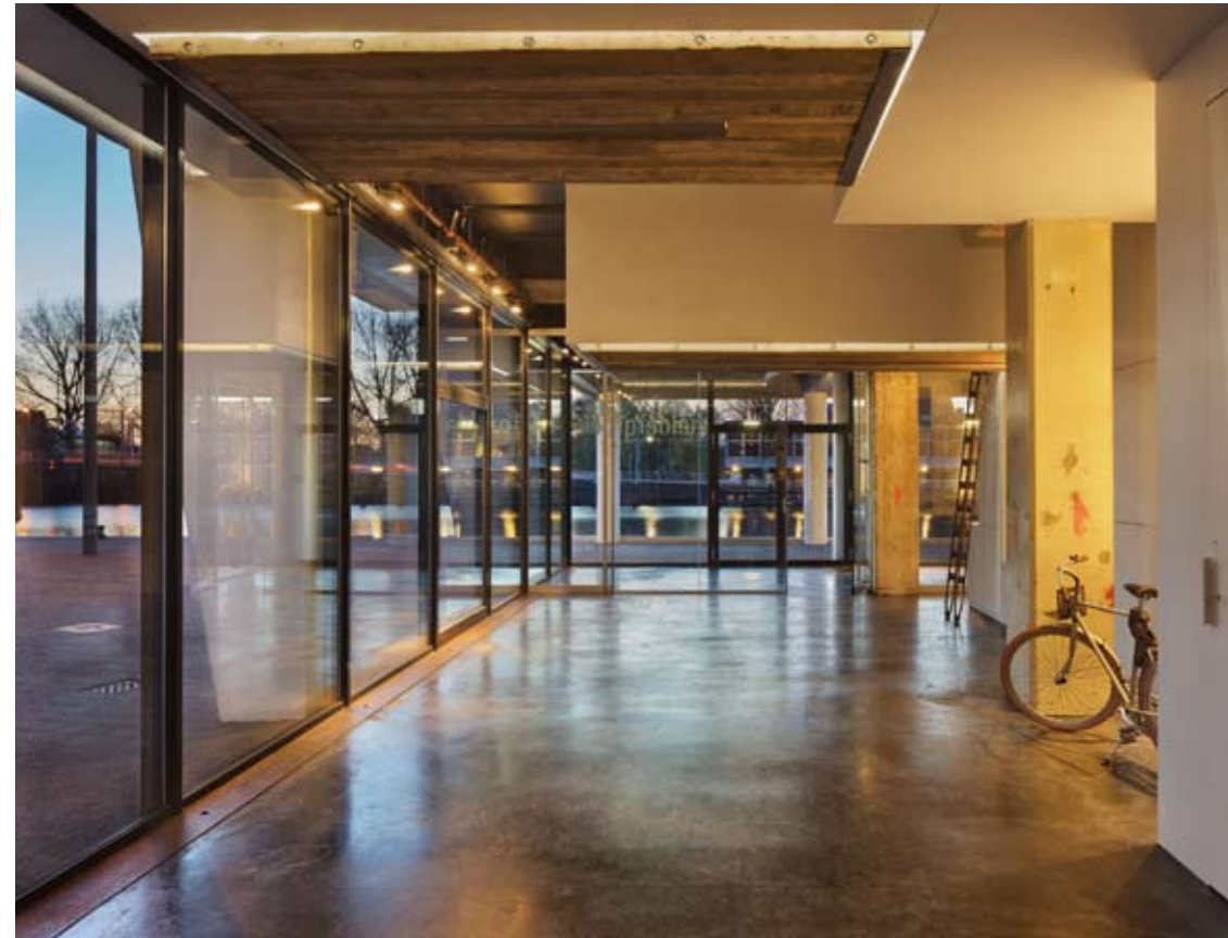
De bureaus zijn met tafelblad en al in een grote bak die aan het plafond hangt verdwenen, zodat er ruimte is voor andere activiteiten.