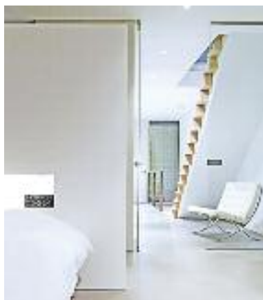
Woning Lisdoddelaan, Amsterdam. Ontwerp: Équipe i.s.m. Idea, 2003.

26 juni Zelfverzonnen op IJburg: Rondleidingen en bijzonderheden Op de Dag van de Architectuur worden op IJburg diverse rondleidingen georganiseerd met nadruk op het particulier opdrachtgeverschap. Informatie over de aanvangstijden van de rondleidingen en de mogelijkheid om u in te schrijven voor een rondleiding vindt u bij het Centrale Informatiepunt op Pedro de Medinalaan 1. Tijdens de Dag worden op diverse locaties op IJburg extra activiteiten georganiseerd. Materia organiseert een presentatie over bijzondere materialen. Het spiksplinternieuwe Mosa Architectural Centre met informatie over 'Custom Made'