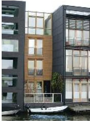
Woonhuis Amsterdam. Ontwerp: Henk Duijzer Bureau LUX.

26 juni Open Huis dL-Architecten Gratis eerste ontwerpconsult Vanuit Amsterdam (Zuid) ontwerpt, tekent en begeleidt dL-Architecten BNA al 12 jaar lang voor particulieren en bedrijven met (ver)bouwplannen, exterieur, interieur en tuin. Traditioneel of vernieuwend; een huis of bedrijfspand moet pas-