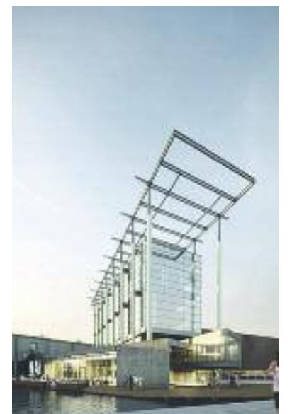
NAI, Rotterdam. Ontwerp: Jo Coenen .

Architectenbureau Drost Bna geeft uitleg aan jong en oud uitleg over wat het vak architect inhoudt en wat een architect voor een opdrachtgever kan betekenen. Locatie: Tentweg 32. Tijd: 10.00 – 12.00 uur. Meer informatie: studio@drost.info .