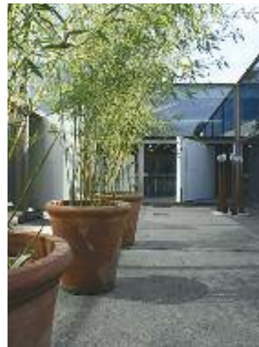
Het kantoor van Inbo, Eindhoven. Architect: Inbo

Drie voorbeelden worden middels maquettes en digitale presentaties getoond: collectief particulier opdrachtgeverschap projecten, waar