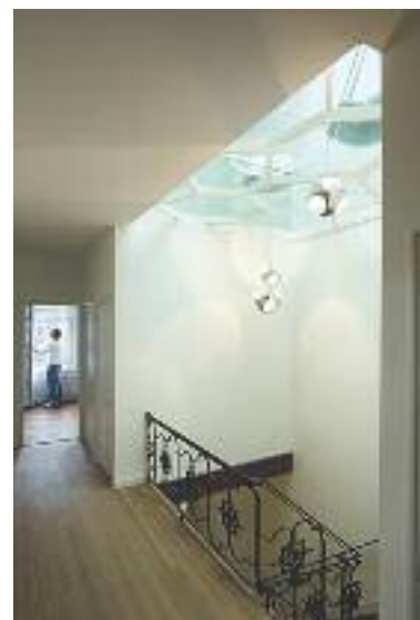
Woonhuis/architectenbureau Kralingen, Rotterdam. Ontwerp: Drexler Guinand Jauslin Architecten .

Neem een exclusief kijkje in het deels zwevende kantoor- en woongebouw van architect Joost Kühne. Een stukje stad wordt hier twee keer gebruikt. Een medewerker van Kühne&Co leidt je rond door het bijzonder vormgegeven smalle werkgebouw met daarboven woonruimte en daktuin, en toont het nieuwe ontwerp van Kühne & Co aan de Mauritsstraat. Locatie: Boomgaardstraat 34. Tijd: 13.30, 14.00, 14.30 en 15.00 uur. Aanmelden en meer informatie: www.dagvande-architectuur-rotterdam.nl .