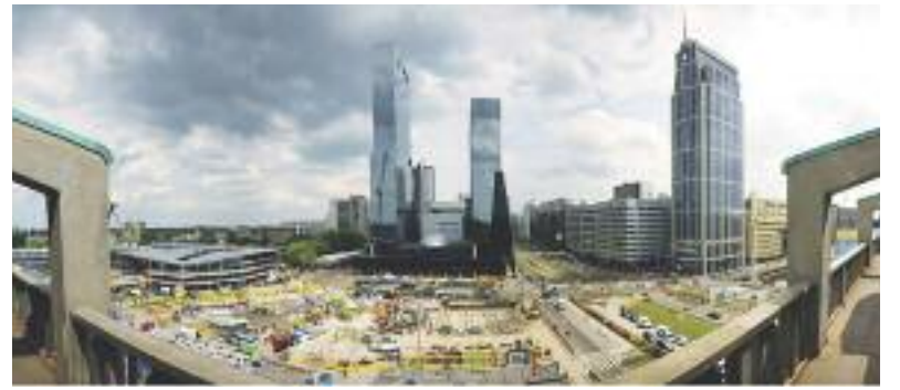
Uitzicht vanaf de galerij van Arconiko architecten, Groothandelsgebouw, Rotterdam

Een woning met architectenbureau in Kralingen (Rotterdam) is volledig gerenoveerd voor de jonge familie van de architect. Terwijl de indeling van de kamers de originele indeling van de woning volgt, zijn belangrijke elementen ontworpen vanuit een hedendaagse benadering. Keuken en badkamer zijn gerenoveerd door zorgvuldig elementen toe te voegen waardoor de kamers hun kwaliteit