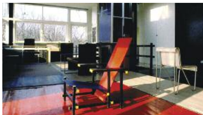
Van links naar rechts: De bouwers van grachtenhuizen in Amsterdam waren gebonden aan streng afgebakende kavels. Hendrik Berlage bouwde jachtslot Sint-Hubertus voor Helene Krölller-Müller. Hij vond haar bemoeizuchtig. Beter verliep de samenwerking tussen Gerrit Rietveld en Truus Schröder-Schräder. Ze creëerden werelderfgoed.