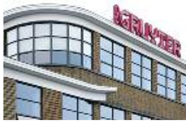
De Gruyterfabriek, bureau van Tarra architectuur & stedenbouw, Den Bosch

De Twee Snoeken zet de deuren open en laat iedereen ervaren wat er bij het bureau, op een vooruitstrevende manier gebeurt. Op het bureau in een gerestaureerd rijksmonument geven medewerkers uitleg over de innovatieve activiteiten van De Twee Snoeken. Doorlopend zijn beelden te zien van gerealiseerde projecten. Geïnteresseerden zullen verrast worden door de inhoud van het gebouw en de inhoud van alle disciplines: architectuur (alles tussen ontwerp en oplevering), inte-