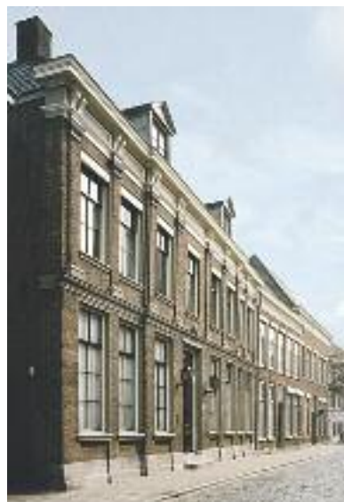
Kantoor De Twee Snoeken, Den Bosch

Locatie: Orthen 51. Tijd: Zaterdag: 11.00 - 17.00. Zondag: 13.00 - 15.00 uur.