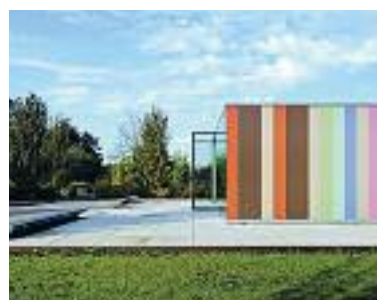
Aula Noorderbegraafplaats, Leeuwarden. Ontwerp: Borren Staalenhoef Architecten.

25 juni Moderne architectuurwandeling – in het centrum Architectuurroute, Open Huis Tjeerd Brouwer, stedenbouwkundige bij de gemeente Leeuwarden, leidt een wandeltocht door de binnenstad langs voornamelijk herbestemmingprojecten. Leeuwarden telt een rijk aantal historische gebouwen die een nieuwe functie hebben gekregen en/of waar op geslaagde wijze een moderne toevoeging is aangebracht. Een waardevolle symbiose tussen oud en nieuw. Het vertrekpunt van de wandeling is het kantoor van Achterbosch Architectuur, met koffie en Open Huis. Tijdens de route komen we langs het 'Open Huis op locatie' van Heldoorn Ruedisulj Architecten in het Piter Jelles Gymnasium, waar architect Jaap Ruedisulj een rondleiding geeft. Locatie: Achterbosch Architectuur, Oosterkade 72 (vertrek-