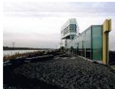
Werkwoning op IJburg, Amsterdam. Ontwerp: Lambert Architecten BNA

26 juni Bas Muilwijk Architectuur Open Huis Bezoekers kunnen een indruk opdoen van de projecten van dit bureau én zijn welkom met vragen die betrekking hebben op hun eigen woon- en/of werksituatie. Locatie : Anton Constandsestraat 48. Tijd: 12.00 – 17.00 uur. Meer informatie: www.sarcodina.nl .