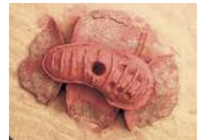
Boomstammen vormen de draagconstructie van het huis. Onder: het ontwerp in klei.