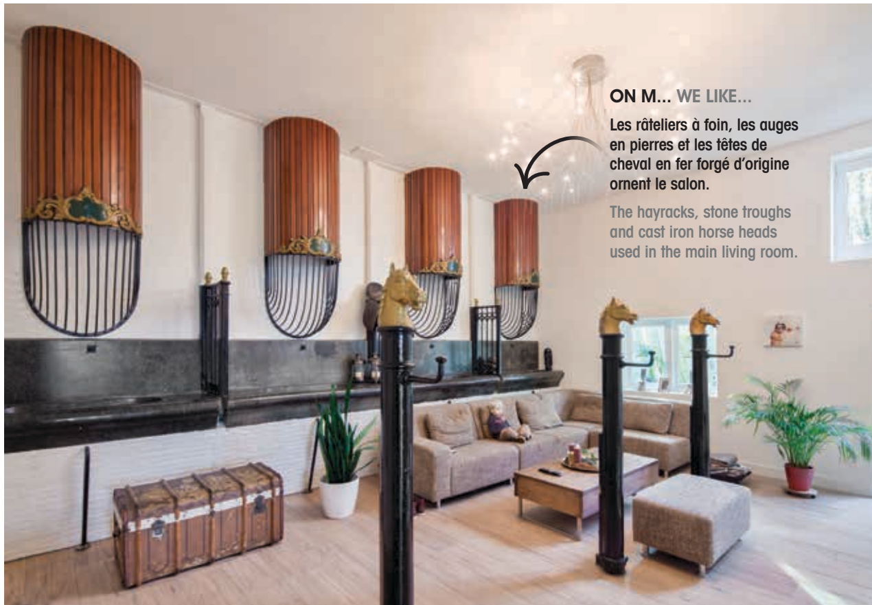
ON M... WE LIKE... Les râteliers à foin, les auges en pierres et les têtes de cheval en fer forgé d'origine ornent le salon. The hayracks, stone troughs and cast iron horse heads used in the main living room.